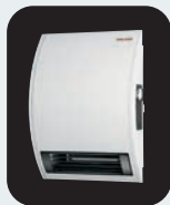
Calentadores Eléctricos de Ambiente