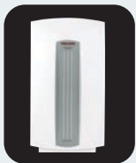
Calentadores de Agua Eléctricos Sin Tanque