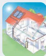
Energía Solar Térmica