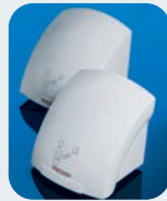
Galaxy™ Secadores de Manos Automáticos